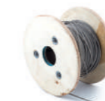
Тросы, зажимы, проволока